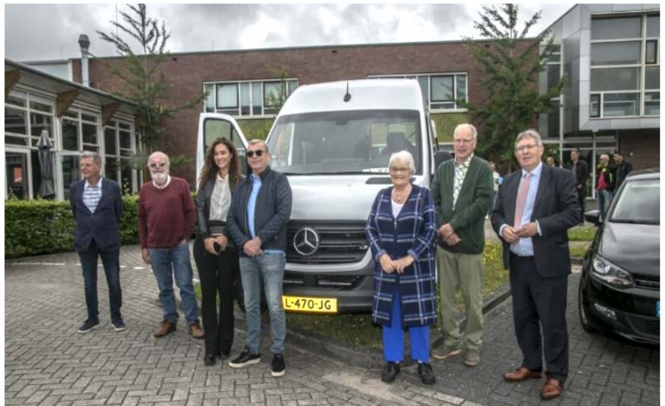
Hij is er, de nieuwe rolstoelbus!

Stichting Vrienden van de Plantage bestaat volgende jaar alweer 25 jaar.